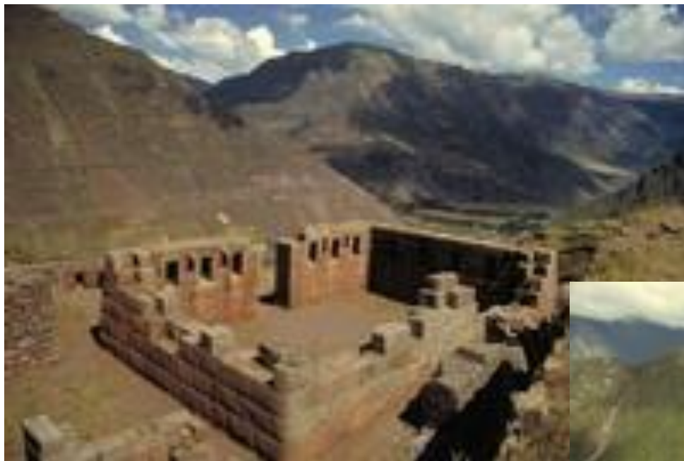
Залишки Мачу-Пікчу – старовинного міста інків. Перу