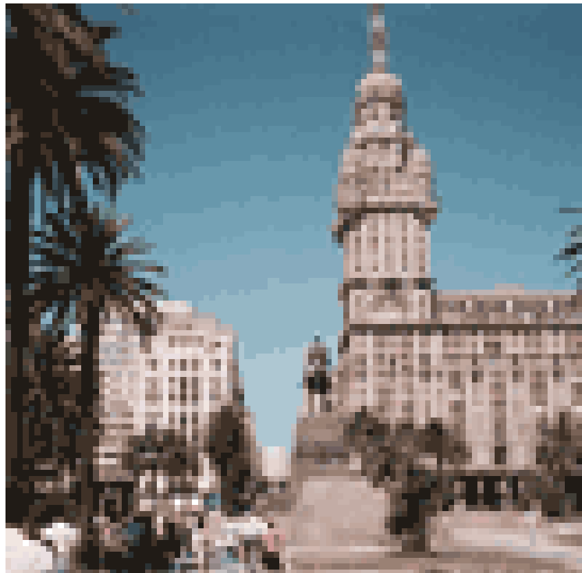
Центральна площа Монтевідео