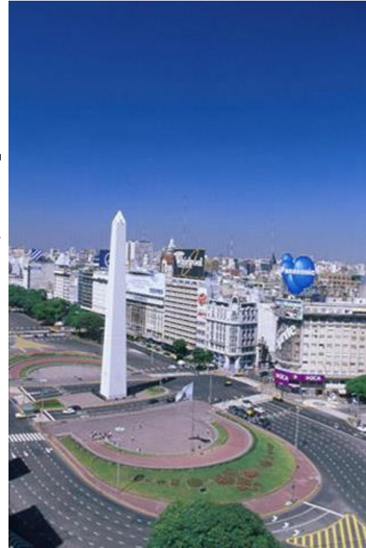
Монумент в Буенос-Айрес (кол. ст.)