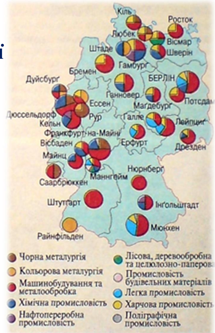
Економічна карта Німеччини