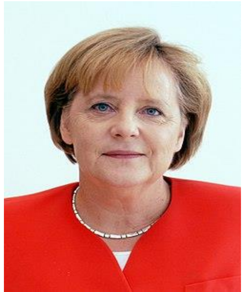
Канцлер: Ангела Меркель