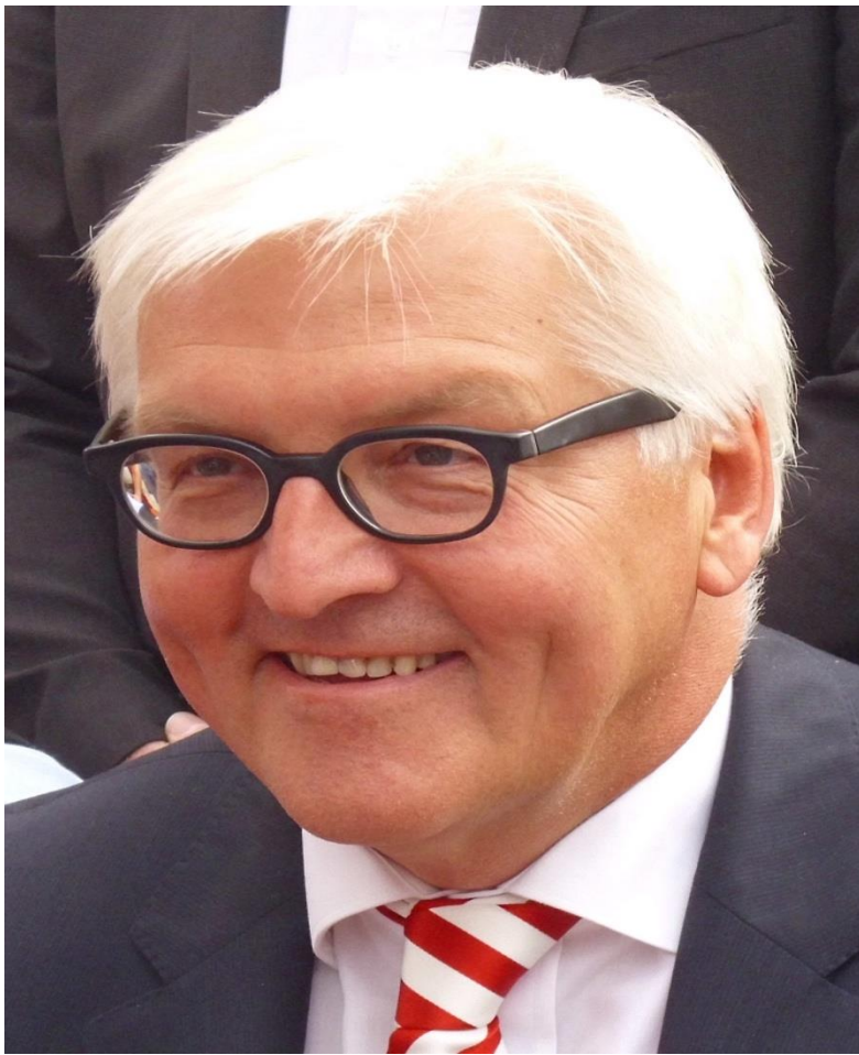
Президент: Франк-Вальтер Штайнмаєр