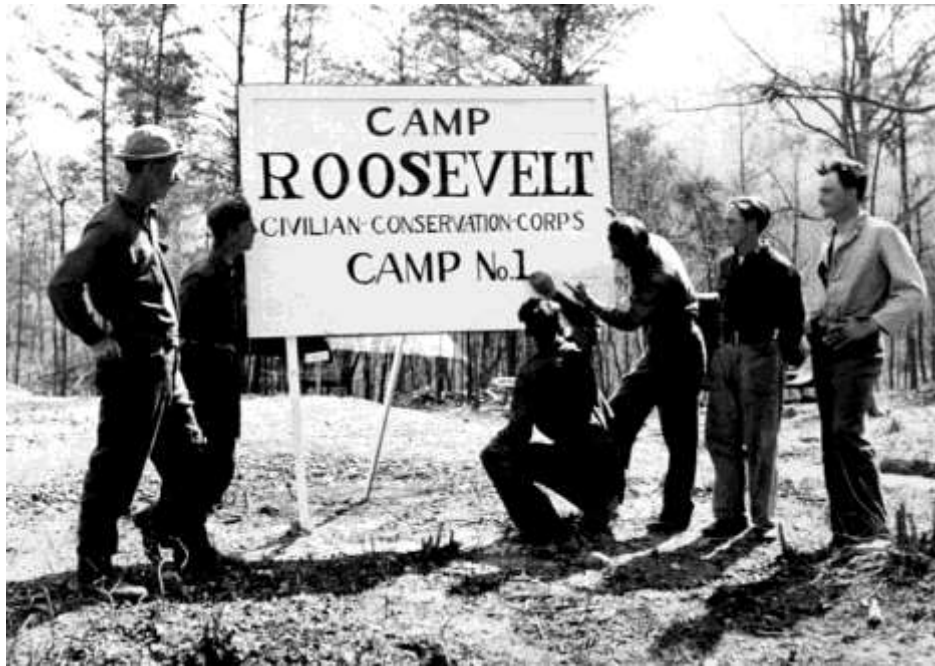
Рис. 1.3. Заснування волонтерської організації Рузвельта [джерело: https://www.thinglink.com/scene/642349517722615808 ]

Наступний пік у волонтерському русі був в 1961 році, коли президент Джон Кеннеді створив організацію "Служителі Миру". Ця організація отримала підтримку більшості університетів США. Починаючи з 1993 року, за президентства Клінтона, волонтерський рух досяг найбільших розмірів. Була створена мережа центрів добровільної допомоги, розпочато цілий ряд державних програм, заснованих на праці добровольців. А після трагедії 11 вересня адміністрація Буша запропонувала проект законодавства, що передбачає розширення загальнонаціональних добровольчих програм, спрямованих на підвищення дієвості суспільно-корисної роботи, яку виконують вчителі, медики, пожежники, співробітники поліції і служб надзвичайного реагування. На поставлене завдання «створити організовану мережу добровольців, готових і здатних займатися надзвичайними ситуаціями, коли б і де б вони не виникали», в першу чергу, «забезпечити безпеку будинків, житлових районів, шкіл» відгукнулися мільйони американців, які поділяють переконання, що «участь добровольців в забезпеченні внутрішньої безпеки країни є нагальною необхідністю».