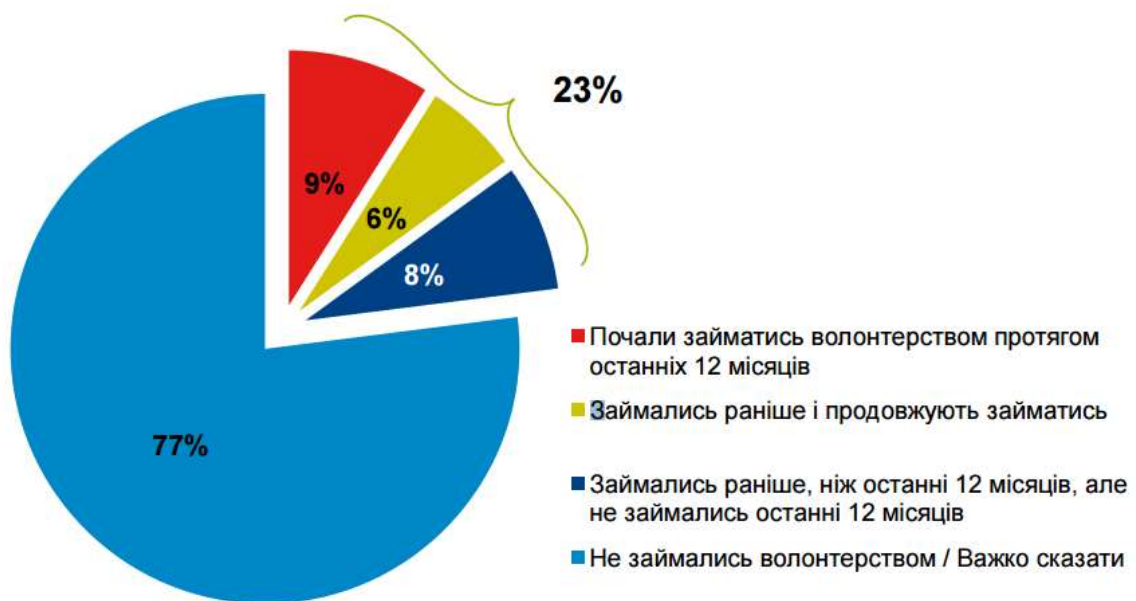
Рис.1.2. Волонтерство в Україні [6]

5 березня 2015 року прийнято Закон України «Про внесення змін до деяких законів України (щодо волонтерської діяльності)», в якому враховуються інтереси всіх волонтерських ініціатив та організацій, які залучають до своєї діяльності волонтерів. Згідно з ним, скасовується обов'язкова реєстрація волонтерських організацій в Міністерстві соціальної політики, визнаються неформальні групи, дозволяється індивідуальна волонтерська діяльність, скасовується обов'язкове страхування. Цей закон не розв'язує усіх проблем, але наближає українське волонтерство до світових стандартів та стає суттєвим кроком до встановлення партнерських стосунків між волонтерами в Україні і державою.