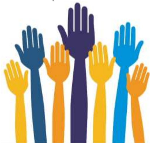
Рис.1.1 Підняті вгору руки – символ волонтерства

Хоча й відсутні порівняльні статистичні дані, дослідження показують, що протягом останнього десятиріччя спостерігається загальна тенденція до зростання кількості волонтерів в усьому світі, але особливо у європейських країнах. Темпи розвитку некомерційного сектору перевищують темпи економічного зростання в цих країнах [3]. Це пов'язано з більш глибоким усвідомленням соціальних та екологічних проблем, залученням волонтерів у сферу надання державних послуг, підвищенням активності літніх людей, а також зміна суспільного сприйняття волонтерства. Сьогодні основними напрямками громадської діяльності є спорт, культура, благочинні проекти, робота у місцевих громадах.