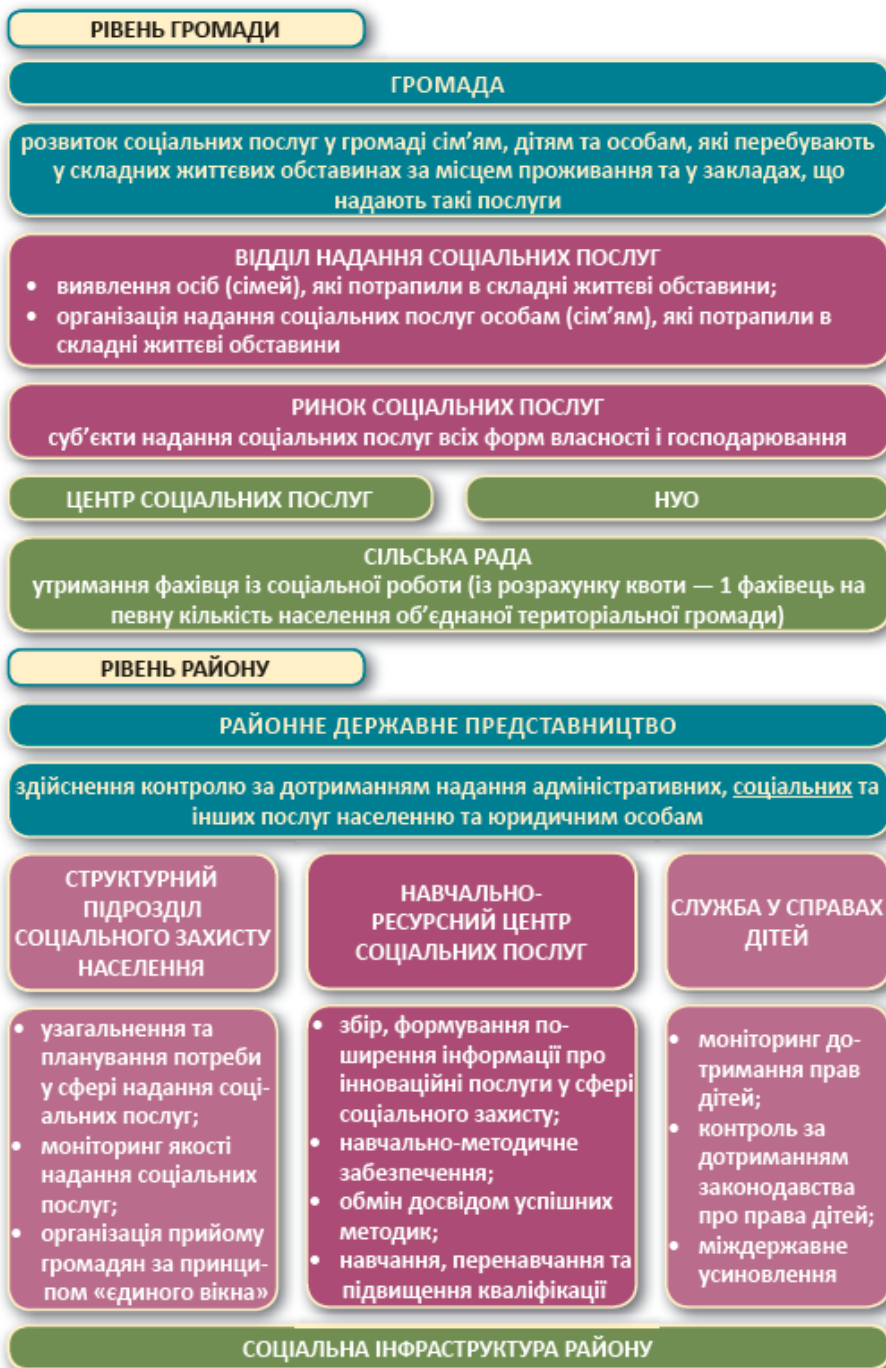
Рисунок 2.1. Реформування системи надання соціальних послуг в Україні згідно реформи децентралізації влади