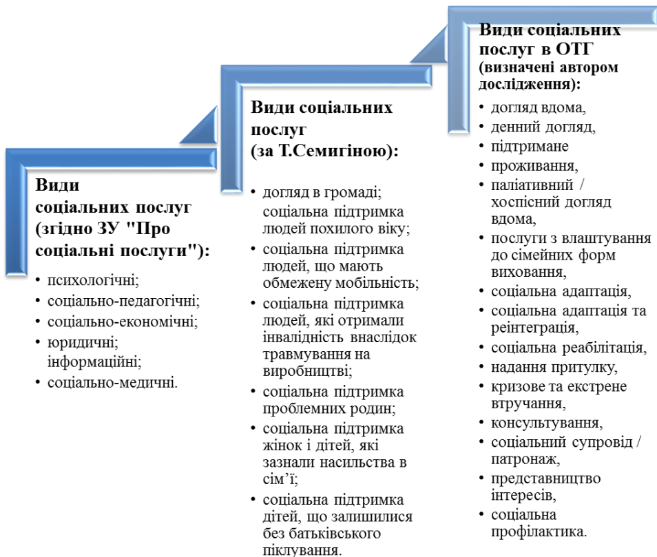
Рисунок 3.1. Види соціальних послуг, що має надавати фахівець із соціальної роботи в ОТГ.

Для надання ефективних, якісних та доступних послуг в ОТГ слід створити та виконувати належні умови (рис. 3.2.); розробити й імплементувати дієві моделі та механізми (рис. 3.3) їх надання.