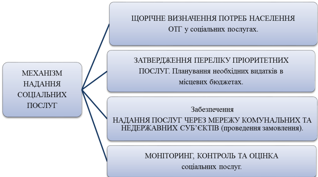
Рисунок 3.3. Механізм надання соціальних послуг в ОТГ