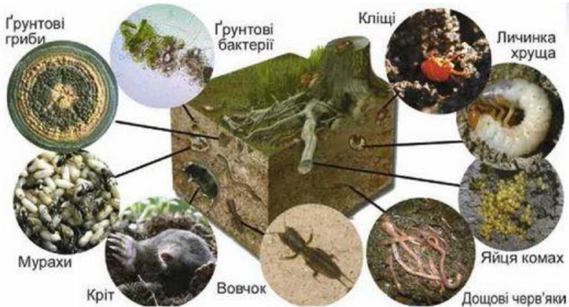
Мал. 155. Мешканці ґрунтового середовища