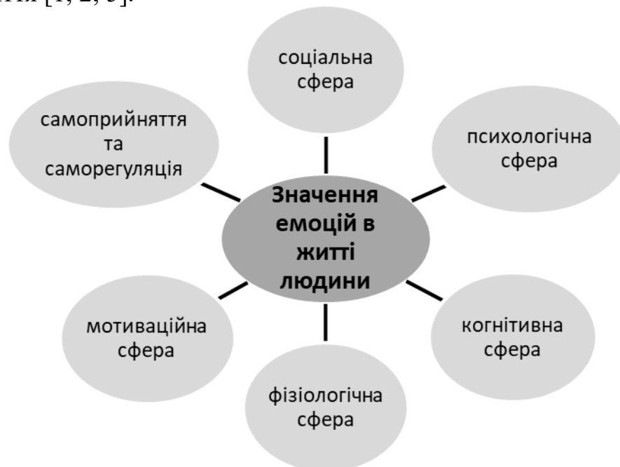
Рис.1: Значення емоцій в житті людини

Відтак, значення емоцій людини дуже вагоме і реалізується в наступних сферах її життя [1; 2; 5].