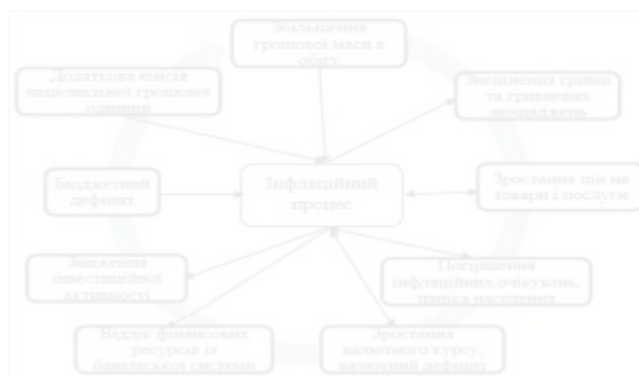
Рис. 4.1. Закономірності розвитку інфляції в Україні

Уряди країн, що діють в рамках однієї з інтелектуальних доктрин, часто шукають зниження рівня інфляції великою ціною, через припинення виробництва і бідності населення. Тому проблему інфляції слід розглядати в контексті макроекономічних взаємозв'язків і їх динаміки.