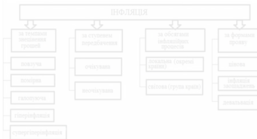
Рис. 2.1 – Види інфляції

У літературі зустрічаються десятки різних формулювань видів інфляції. Найбільш коректною є класифікація видів інфляції за трьома критеріями: формами прояву, темпами ліквідації грошей, характером охоплення і ступеня передбачення (рис. 2.1).