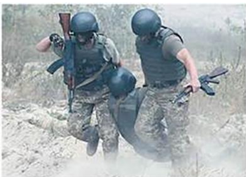
Перетягування двома рятівниками