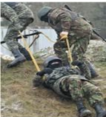
Волочіння двома людьми.