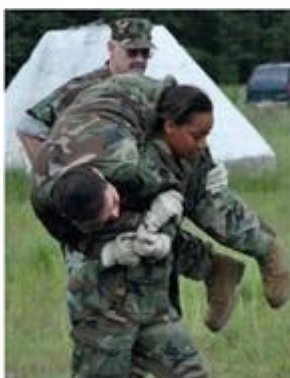
Перенесення на плечі. Відпрацювати.

Перенесення на спині (метод Хауса) здійснити набагато легше. Захопіть зап'ясток і передпліччя пораненого через одне плече і нахиліться вперед, відірвавши його від землі.