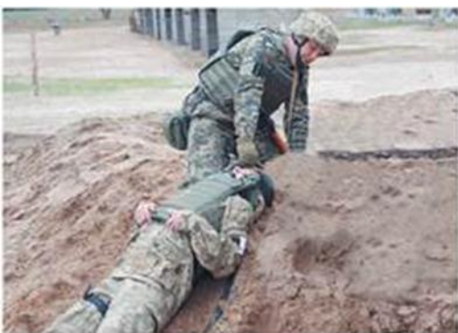
Перетягування одним рятівником