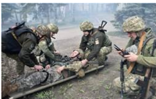
Перенесення на ношах.

Це найкраща позиція для спостереження за станом постраждалого під час перенесення його на ношах. Носильники опускаються на ближче до нош коліно та беруться за ручки нош. За командою керівника, четверо носильників одночасно піднімають ноші й починають рухатись одночасно, транспортуючи постраждалого до медичного пункту.