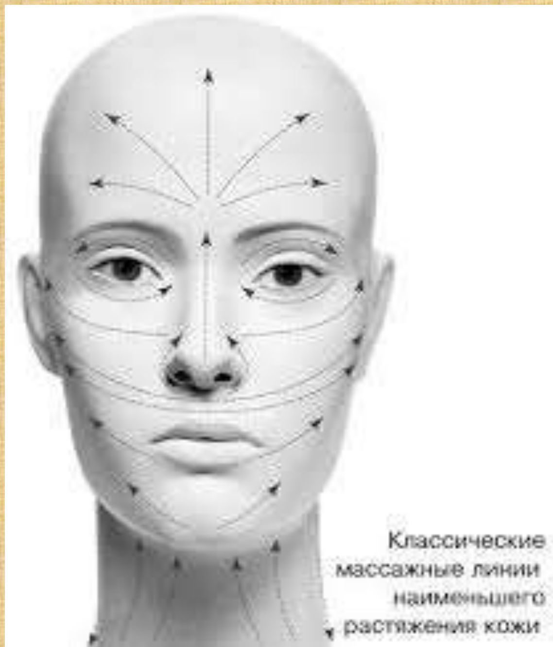
Классические массажные линии наименьшего растяжения кожи