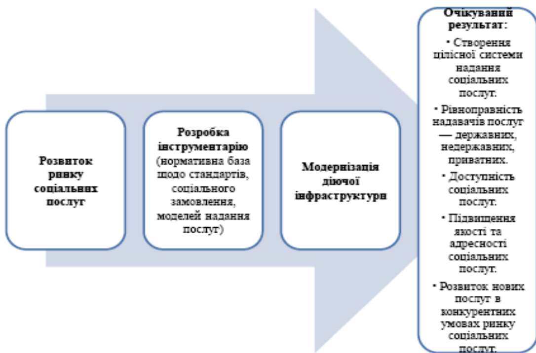
Рис. 3. Напрями реформування системи надання соціальних послуг в Україні

Україна перебуває на активному етапі впровадження цілісної системи соціальних послуг на рівні ОТГ та запровадження механізмів стимулювання підвищення їх якості та фінансування за принципом «гроші йдуть за отримувачем послуг».