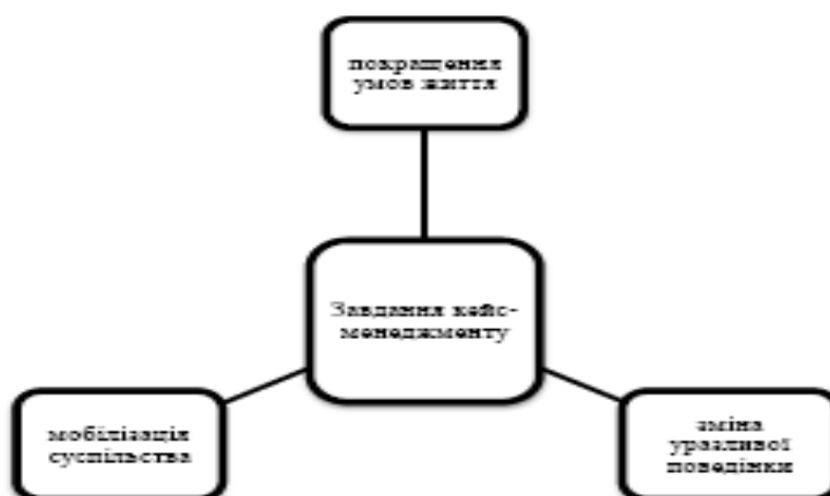
Рис. 5. Очікувані результати застосування кейс-менеджменту

В основі «casework» лежить проблемна ситуація, яка негативно впливає на якість життя клієнта, в нашому випадку переміщення вищеописаної категорії осіб, їх оточення, що призводить або призвело до психологічної напруги, яка має багато причин. Очікувані результати застосування кейс-менеджменту (рис. 5)