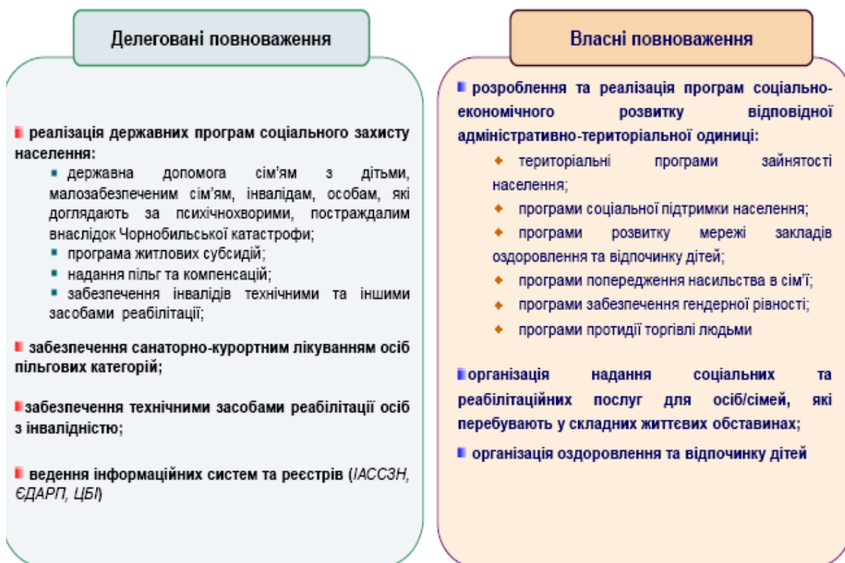
Рис. 1. Розподіл повноважень та функцій у сфері соціальної політики територіальних органів Міністерства соціальної політики та органів місцевого самоврядування

У такому контексті на рівні ОТГ здійснюються такі види діяльності: просвітницька, профілактична, консультаційна, соціально-виховна, реабілітаційна, активаційна, освітня тощо.