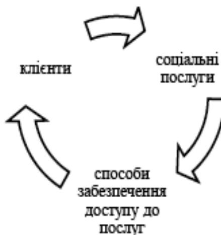
Рис. 6. Структура надання послуг в кейс-менеджменті

Як метод соціальної роботи кейс менеджмент можна використовувати в індивідуальній роботі, груповій роботі та в громаді.