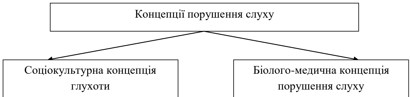
Рис. 1.1. Концепції порушення слуху

У сучасній та зарубіжній літературі обґрунтовуються основні концепції порушення слуху: соціокультурна і біолого-медична (рис. 1.1) [47].