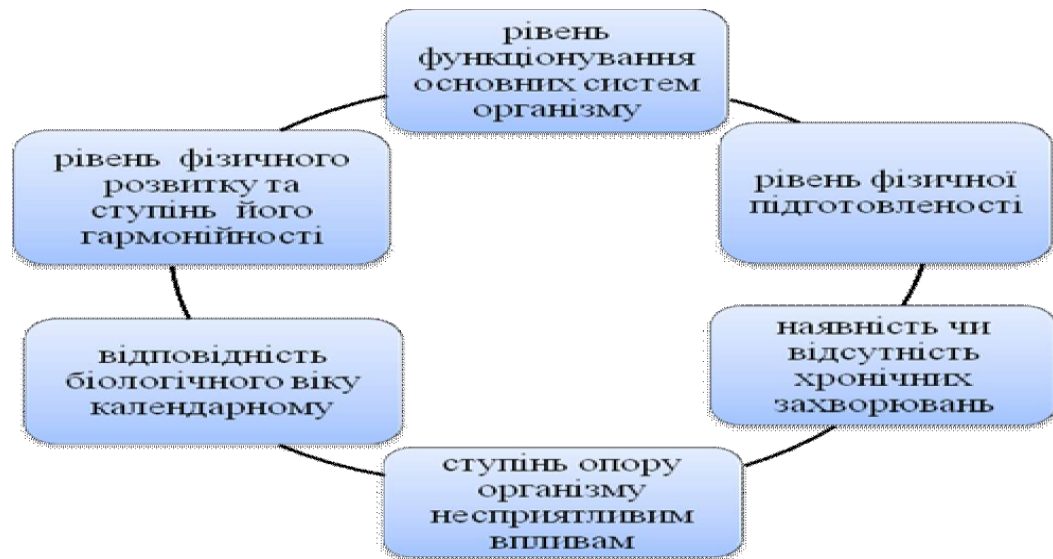
Рис. 1.4. Критерії для оцінки фізичного стану дітей [44]

Оцінка фізичного стану дітей визначається за рядом критеріїв (рис. 1.4) [44].