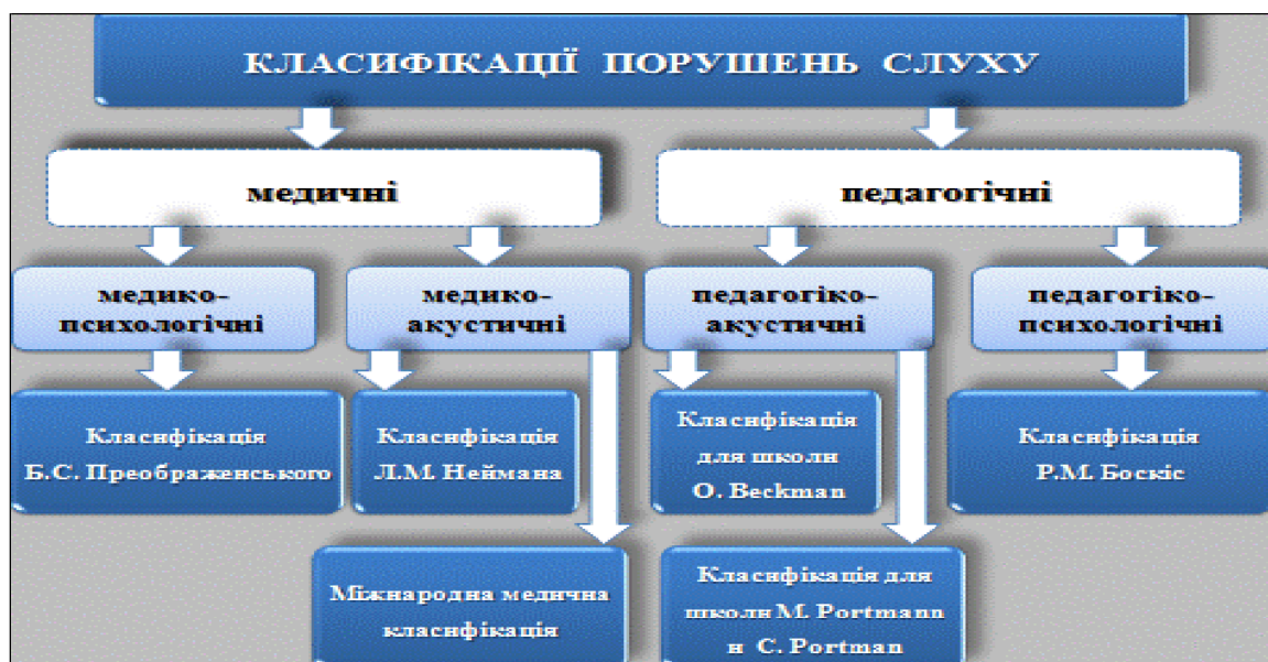
Рис. 1.2. Система класифікацій порушень слуху [48]

Проведений системний аналіз існуючих класифікацій порушень слуху дозволив встановити, що змістовними визначальними складовими кожної класифікації є характер втрати слухової функції і стан мови (рис. 1.2).