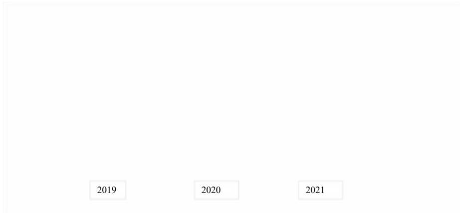
Рис. 2.1. Питома вага джерел формування капіталу

збільшилися забезпечення наступних витрат і платежів. Кредиторська заборгованість збільшила свою вартість на 269,0 тис. грн., і на кінець 2021 р. становила 1992,0 тис. грн. Графічне зображення показників питомої ваги джерел формування капіталу агрофірми «Вересень» показано на рис. 2.1.