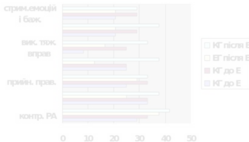
Рис. 3.3. Аналіз рівня підвищення якості життя та рухової активності (експериментальна група)

За даними, представленими на рисунку 3.1, при оцінці рівня довільної сформованості в контрольній групі дошкільників за період дослідження динаміка була значно нижчою на 7,1%. Якість життя та рівень фізичної активності дитини низький: дитина не завжди може контролювати свою фізичну активність; складні рухові рухи можна виконувати лише під чітким керівництвом вчителя; не завжди може виконувати рухи, які вимагає вчитель; Модель, на яку дивляться дорослі, але може протистояти імпульсивній поведінці та грати в різноманітні ігри, які частково відповідають правилам.