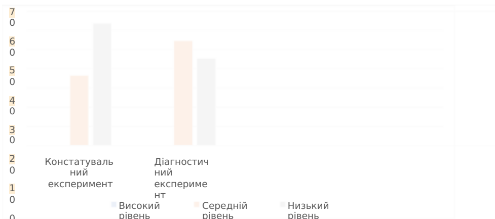
Рис. 2.2. Порівняльні показники правильності читання у другокласників із ЗПР на констатувальному етапі та після формувального навчання

Як бачимо, після формувального навчання кількість учнів із ЗПР, які припустилися під час читання більше 10 помилок зменшилася. Так, якщо на етапі констатувального експерименту дітей з низьким рівнем правильності читання було 7 (63,6%), то після корекційно-розвивальної роботи їх стало 5 (45,5%). Натомість показники середнього рівня збільшилися з 36,4% до 54,5%. Такі кількісні показники засвідчують про позитивну тенденцію, хоча достатнього та високого рівнів сформованості правильності читання у другокласників із ЗПР все ж таки не було виявлено.