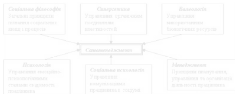
Рис. 1.2.1. вплив наукової орієнтації на самоменеджмент (за К.А. Андрущенко).

створення збалансованої, інноваційної, креативної та продуктивної соціально-економічної організації.