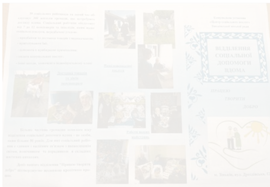
Рис. 2.2. Інформаційний буклет «Відділення соціальної допомоги вдома»

На сьогодні у відділенні соціальної допомоги вдома отримують соціальну послугу догляду вдома 296 осіб. 39 соціальних робітників надають заходи, що складають зміст соціальної послуги догляду вдома (Рис.2.2.)