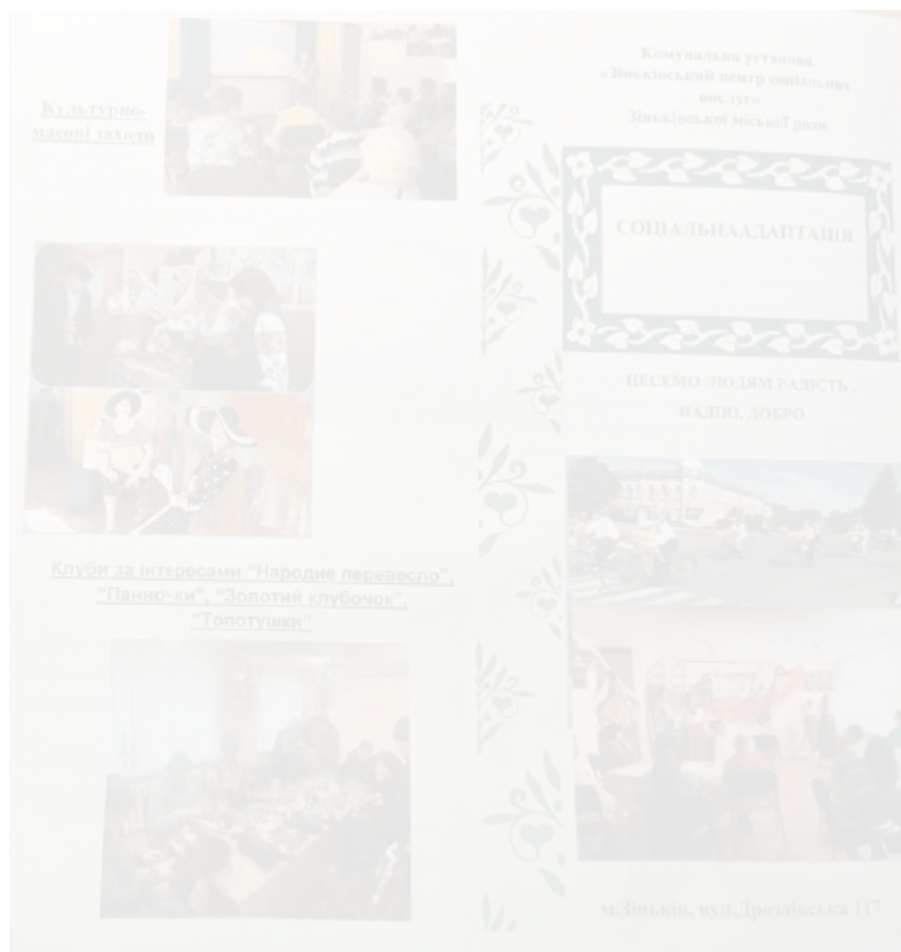
Рис. 2.3.6. Робота клубів за інтересами

На сьогоднішній день в Центрі працює 65 працівників: соціальні працівники та соціальні робітники, робітники по наданню побутових послуг (швачки, перукар, взуттєвик, робітник з ремонту споруд), спеціалісти бухгалтерського відділу, завідувачі відділів, фахівці з соціальної роботи, водій та інші.