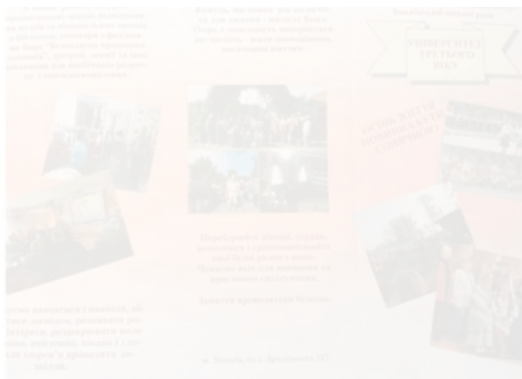
Рис. 2.3.3. Інформаційний буклет «Університет третього віку»