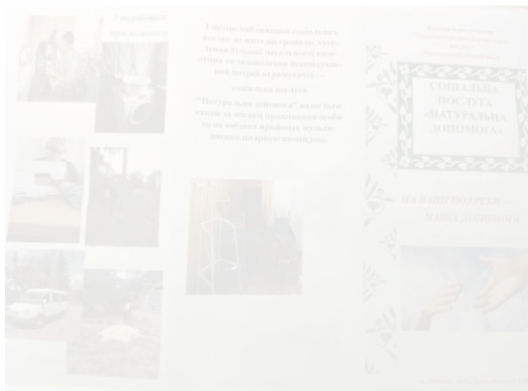
Рис. 2.3.1. Інформаційний буклет «Соціальна послуга «Натуральна ДОПОМОГА »

«Бюро добрих справ» для незахищених верств населення громади. Послуга натуральної допомоги надається громадянам, які перебувають у складних життєвих обставинах відповідно до порядку організації надання соціальних послуг та Державного стандарту, в яких визначені категорії отримувачів та порядок оцінки індивідуальних потреб у соціальній послугі. Виходячи з можливостей, наявної фінансової та матеріально-технічної бази відділення може безоплатно забезпечувати громадян одягом, взуттям, продовольчими товарами.