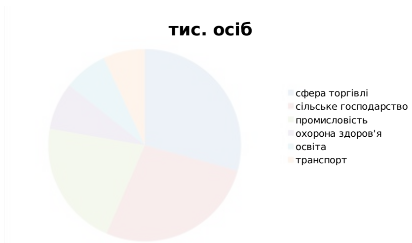
Рис. 2.1. Структура зайнятості за видами економічної діяльності по Полтавській області за 2024 рік

За методологією Міжнародної організації праці чисельність безробітного населення в 2021 році становила 78,1 тис. осіб, в тому числі 39,7 тис. жінок і 38,4 тис. чоловіків. Показник рівня безробіття населення (за методологією МОП) становив 12,4% робочої сили, зокрема серед жінок 13,0% а чоловіків, відповідно 11,9%.