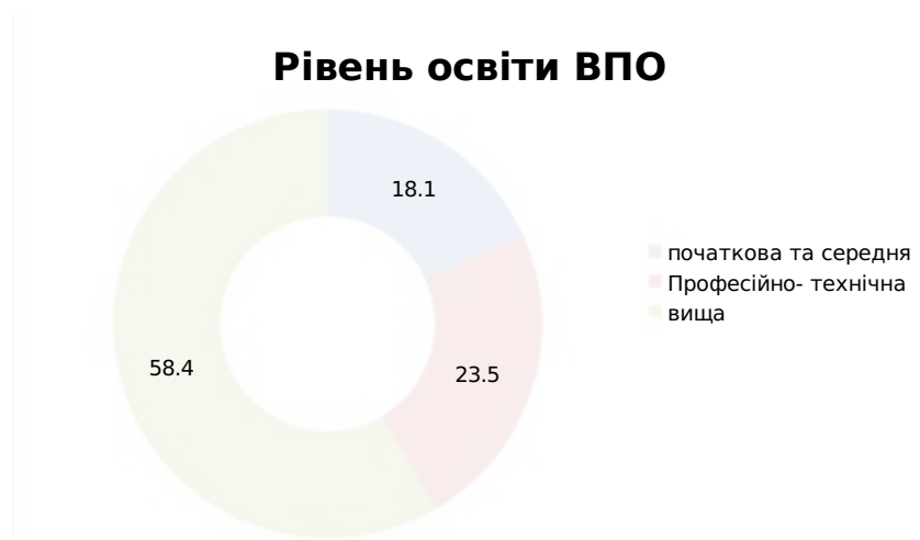
Рис.2.3. Розподіл за рівнем освіти безробітних з числа ВПО, зареєстрованих в Полтавській філії Полтавського обласного центру зайнятості станом на 01.04.2024 року

При цьому серед всіх безробітних питома вага осіб з вищою освітою становить менше 42,3%, з професійно-технічною — 58,4%, із середньою — 21,3%. Характерною особливістю є те, що частка ВПО з вищою освітою переважає в місті Полтава – більше 68 %, в сільських населених пунктах – 41,6 %.