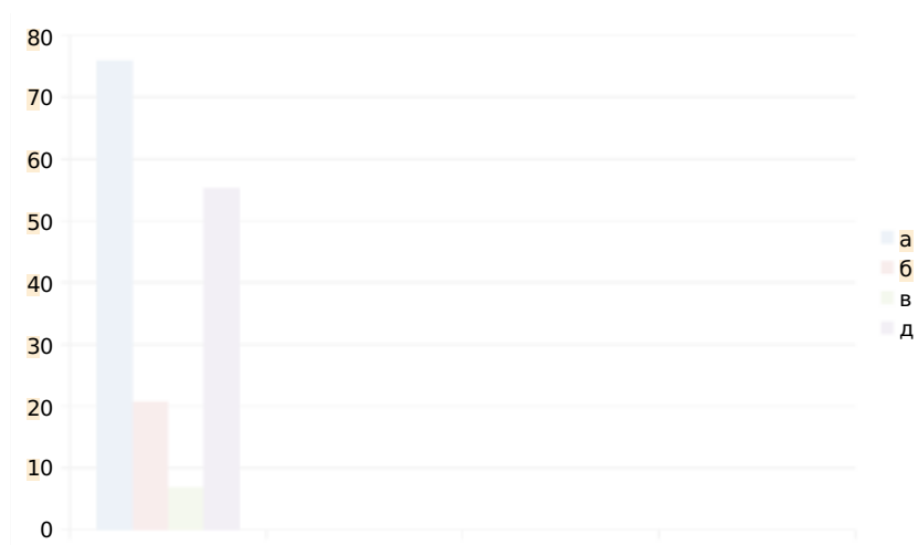
Рис. 3.5. «Як саме має здійснюватися спеціальна підготовка майбутніх соціальних працівників до роботи з дітьми з обмеженими можливостями здоров'я?»

Отримані відповіді свідчать про те, що спеціальна підготовка майбутніх соціальних працівників до роботи з дітьми з інвалідністю має здійснюватися насамперед у процесі навчання у ЗВО, у процесі подальшої професійної діяльності в соціальних установах, а вже потім шляхом підвищення кваліфікації та самостійно, на волонтерських засадах. Крім того, респонденти зазначали, що бракує практичних навичок, отриманих під час навчання; потрібні спеціалізовані стажування, під час яких студенти могли б знайомитися з дітьми з обмеженими можливостями здоров'я, практикували