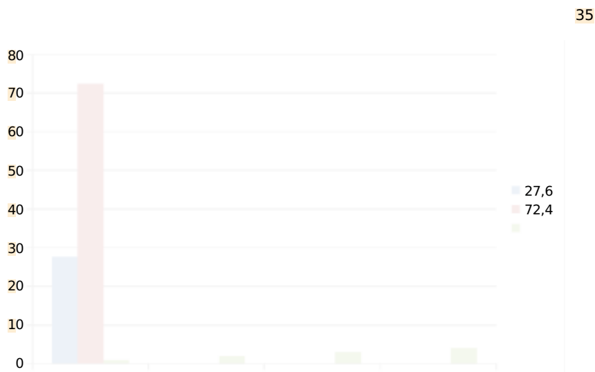
Рис. 3.3. «Чи виникають в процесі Вашої роботи з дітьми, що мають інвалідність труднощі в психологічно-емоційному сприйнятті, взаєморозумінні один одного, спілкуванні тощо?»

При цьому можна прослідкувати певну залежність відповіді від стажу роботи в соціальних службах. Так, варіант відповіді (а) вибрали респонденти з малим (від року до трьох) стажем роботи, а варіант відповіді (б) вибрали респонденти зі стажем роботи від трьох до дванадцяти років.