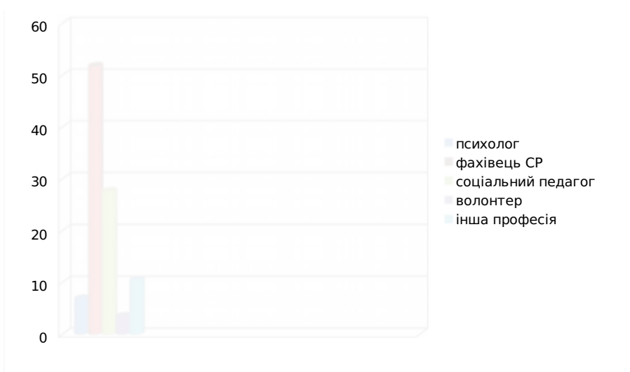
Рис. 3.1. Кваліфікація працівників соціальних служб

Згідно з четвертим запитанням, респонденти вказали, чи мають вони навички практичної роботи з дітьми з інвалідністю. Всі 29 респондентів (100%) дали позитивну відповідь.