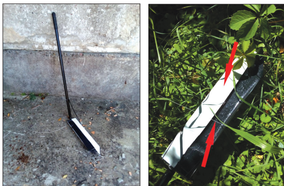
Рис.1 Експериментальний зразок

забезпечує обмеження притискання зеркала до поверхні землі і оберігає поверхню дзеркала від можливого нанесення подряпин, тріщин, механічного пошкодження або сколів [4].