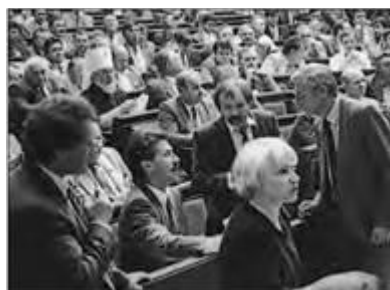
Верховна Рада УРСР I скликання. 1990 р.