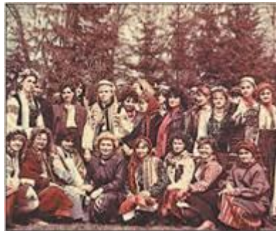
Члени Товариства Лева на Великдень. 10 квітня 1988 р.

У травні 1989 р. пройшов установчий з'їзд Українського історико-просвітницького товариства «Меморіал».