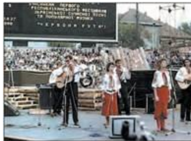
Перший фестиваль української сучасної пісні «Червона рута». Чернівці. 1989 р.