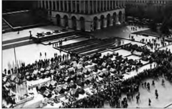
Територія, вільна від комунізму. Наметове містечко в центрі Києва під час «революції на граніті». Жовтень 1990 р.

Посилення кризових явищ в економіці республіки, політизація суспільства впливали на радикалізацію Народного руху як політичної сили. На II З'їзді Народного руху України (жовтень 1990 р.) партія суттєво змінила політичні орієнтири, що засвідчило гасло «Від Народного руху за перебудову — до Народного руху за відродження суверенітету України».