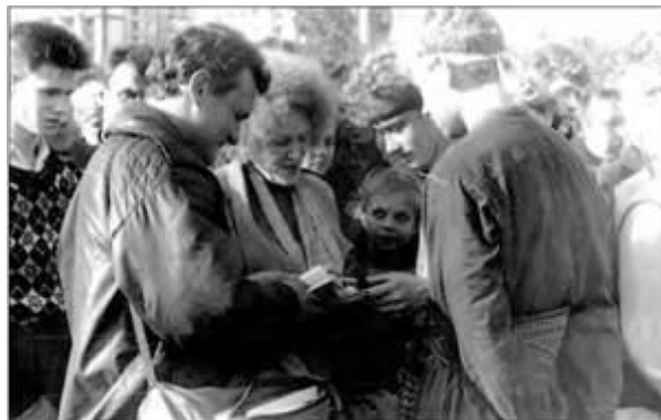
Поетеса Ліна Костенко в таборі голодуючих. Жовтень 1990 р.

Наприкінці 1990 р. чітко визначилася розстановка нових політичних партій України: на правому фланзі — Українська християнсько-демократична партія (УХДП), Українська народно-демократична партія (УНДП), Українська республіканська партія (УРП); у центрі — Українська селянська демократична партія (УСДП), Партія зелених України, Партія демократичного відродження України (ПДВУ); на лівому фланзі — Спілка трудящих України за соціалістичну перебудову (СТУ) та інші.