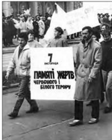
Демонстрація 7 листопада 1990 р. Южноукраїнськ (Миколаївська обл.)

Саме «Червона рута» стала першим замовником на технічне (сцена, звук, світло, студії звукозапису, музичне обладнання, тиражування музичної продукції) і творче (композитори, аранжувальники, звукорежисери, поети тощо) забезпечення таких заходів.