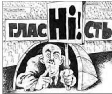
Карикатура на «гласність». 1980-ті рр.

2. УСУНЕННЯ З ПОСАДИ В. ЩЕРБИЦЬКОГО. На відміну від Москви, де політичні процеси в перші роки «перебудови» відбувалися більш інтенсивно, в Україні продовжував панувати «застій». У першу чергу його пов'язували з ім'ям першого секретаря ЦК КПУ В. Щербицького.