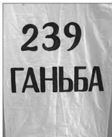
Банер із протестом проти «групи 239». 1990 р.

У Верховній Раді УРСР утворилася парламентська більшість («група 239»), у якій поряд із прагматиками, що швидко реагували на різкі зміни обставин, було чимало відвертих консерваторів, та парламентська опозиція — Народна рада (125 депутатів), яка складалася з прибічників як поміркованих, так і радикальних поглядів. Парламентську опозицію очолив Ігор Юхновський.