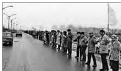
Живий ланцюг. 21 січня 1990 р.