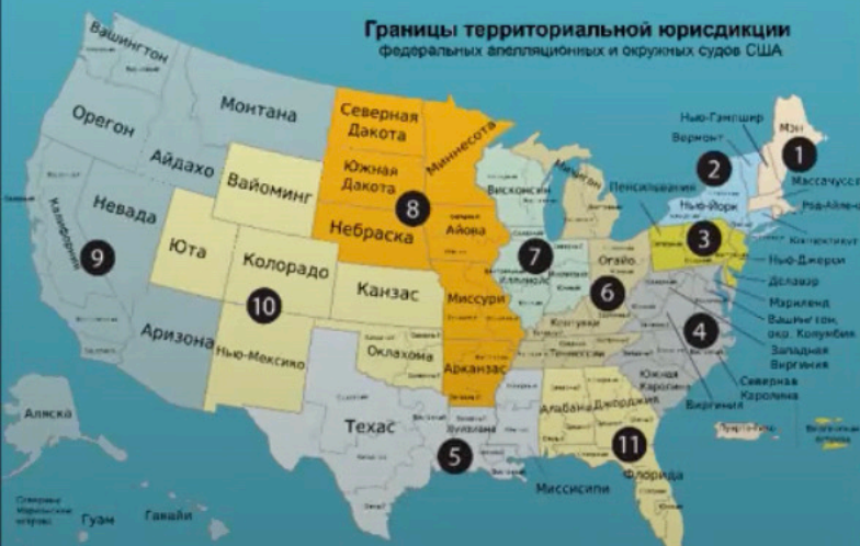
Судові округи США